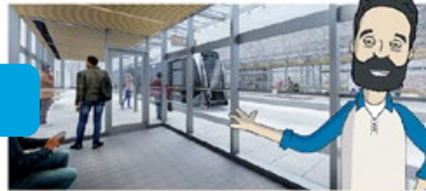
Les rails resteront dégagés, même en hiver, grâce au passage en continu des rames de tramway. Image : Station CHUL, Sainte-Foy.