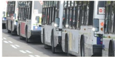
Un tramway transportera 260 passagers. C'est quatre fois plus qu'un autobus régulier.

MYTHE On devrait juste rajouter des autobus au lieu de choisir le tramway.